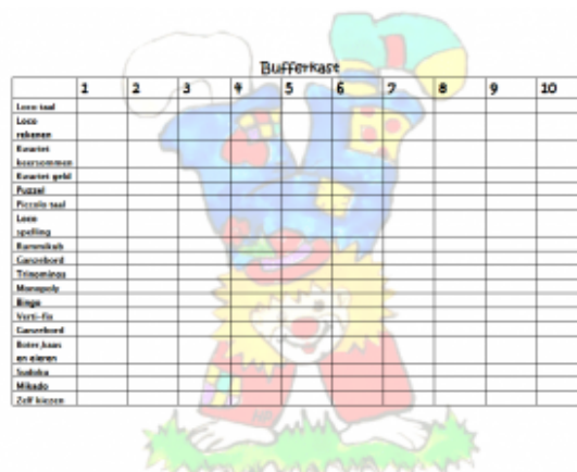
Voorbeeld van aftekenlijst klaarwerk