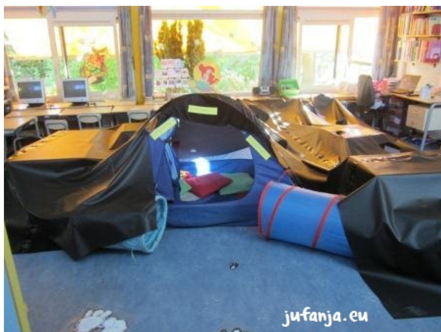
Konijnenhol: de leerlingen